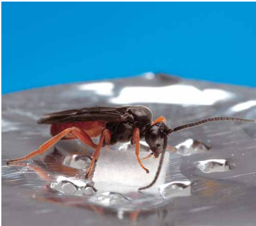
I løpet av noen minutter har vepsen lært seg å gjenkjenne skatol og androstenon.